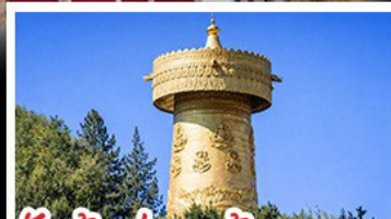
วัดต้าฝอ กงล้อมนตรา