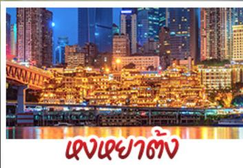
แดงเซาตั้ง