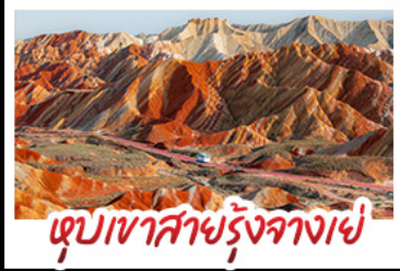
หุบเขาสายรุ้งฉางย่า