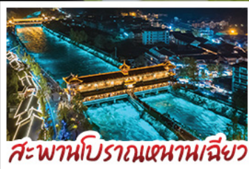
สะพานโบราณเขานางฟ้า