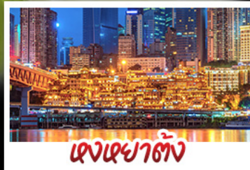
เจดีย์ต้าเจี๋ย