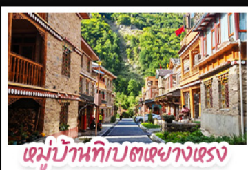
หมู่บ้านทิบตหยางตรง

ตะลุยเจียงตู คูหิมะต้ากู่ปิงชวณ ชวนเซ็กคิวนแพนด้ายักษ์ พักใจที่หยดน้ำดาสีฟ้า! แวะชิลเมืองโบราณลั่วไต้ สัมผัสมนต์เสน่ห์ หมู่บ้านทิบตหยางหงชวาต่อ สัมผัสความหนาวเย็นที่ อู๋ชานสวรรค์ธารน้ำแข็งต้ากู่ปิงชวณ แหล่งรวมวิวหลักล้าน ตื่นตาไปกับแสงสียามค่ำคืน หยดน้ำดาสีฟ้า ณ สะพานหนานเฉียว เมืองคูเจียงเยียน ก่อนปิดท้ายด้วยการช้อปปิ้งจุใจ ถนนชุนชี่-ไถ่กู่หลี่ และเซะภาพกับ แพนด้าเซลฟี่ สุดคิวท์