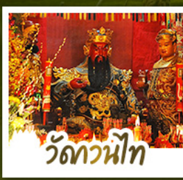
วัดกวนี่ไท