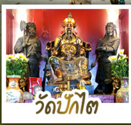
วัดป้กัไต้