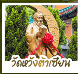
วัดเขว้ดงต้าเซีงน