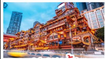
แสงเซาตัง

อุทยานหลุมบ่อฟ้า - อุทยานเทานางฟ้า หงหยาดัง - นั่งรถไฟทะลุติ๊ก - อุทยานสี่ดรุณี ปี่ผิงโกว - สะพานหนานเฉียว