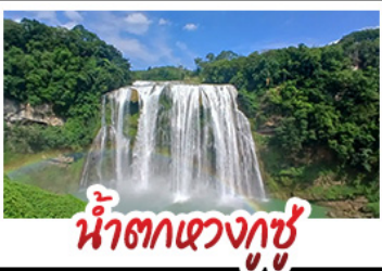
น้ำตกเขวงกูซู่

14-19 พ.ย.69 ราคา 21,888 บาท / 10-15 ธ.ค.69 ราคา 19,888 บาท / 12-17 ธ.ค.69 ราคา 19,888 บาท 17-22 ธ.ค.69 ราคา 20,888 บาท / 26-31 ธ.ค.69 ราคา 23,888 บาท