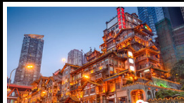
ตลาดแดงเซชาติง