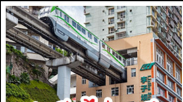
สถานีรถไฟทะเลลึก

11 - 15 มิ.ย. 69 21,888 13 - 17 มิ.ย. 69 20,888 18 - 22 มิ.ย. 69 21,888 20 - 24 มิ.ย. 69 20,888 25 - 29 มิ.ย. 69 21,888 27 มิ.ย. - 01 ก.ค. 69 20,888