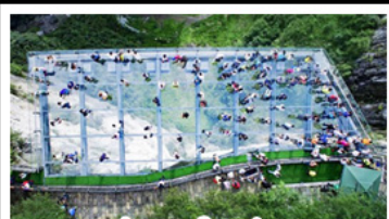
ระเบียงแก้วอุยเนง