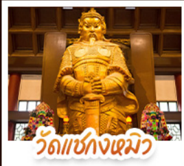
วัดเชกงเมว