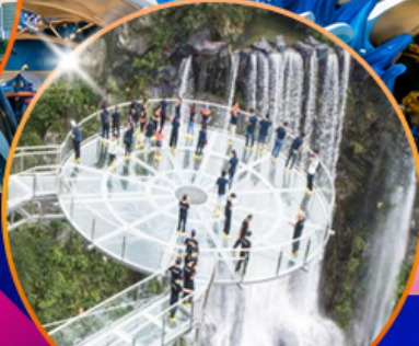
สะพานแก้วกู่หลงเซี่ยะ