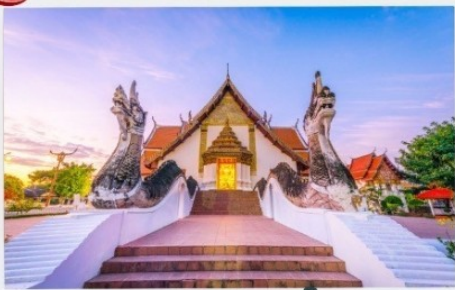
วัดภูมินทร์