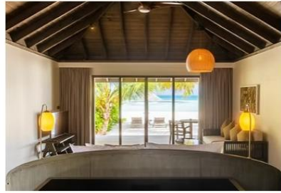
Dheru Beach Villa