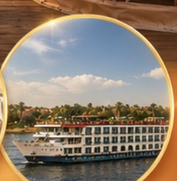
ล่องเรือแม่น้ำไนล์