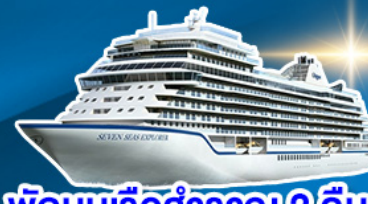
พักผ่อนเรือสำราญ 2 คืน