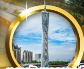
แคนตันทาวเวอร์