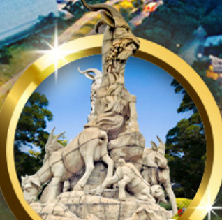
อนุสาวรีย์แพะห้าตัว