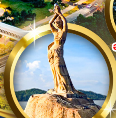
จูไห่พีชเชอร์เกิร์ล