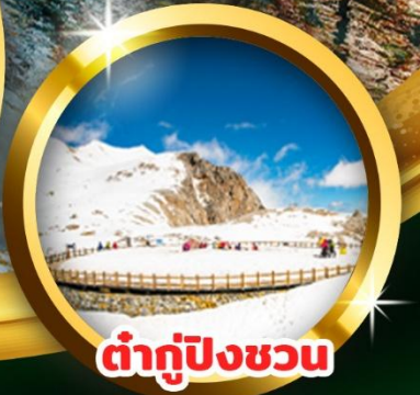
ต่ากู่ปิงชวณ