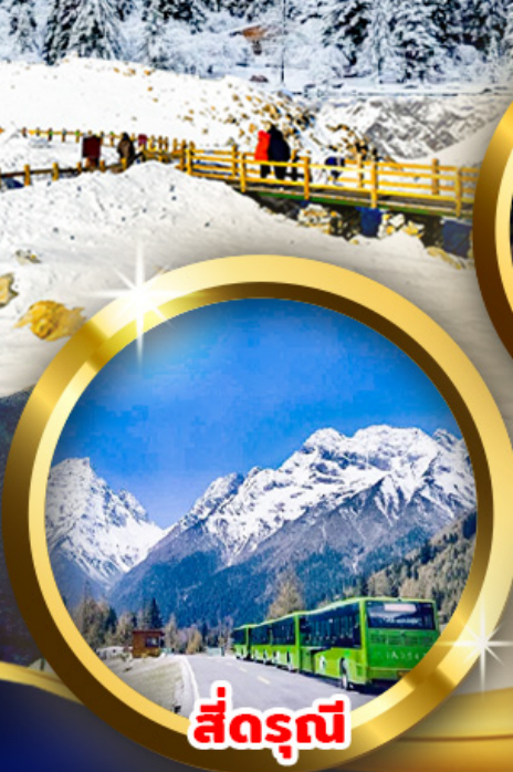
สี่ดรุณี