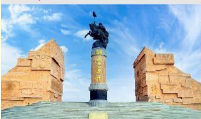
เขตท่องเที่ยวเจงกีสข่าน