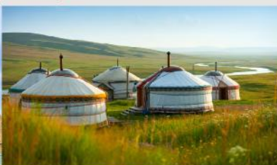
ที่พักแบบกระโจม