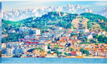
หมู่บ้านชาวประมงซาจื่อโฮว