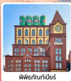
พิพิธภัณฑ์เบียร์