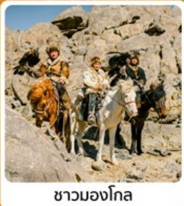
ชามองโกเลีย