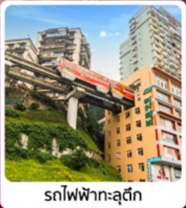
รถไฟฟ้ากระตุ๊ก