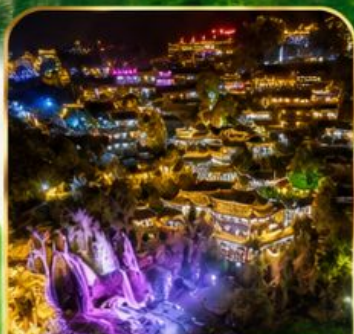
เมืองโบราณผู่หลงเจิน