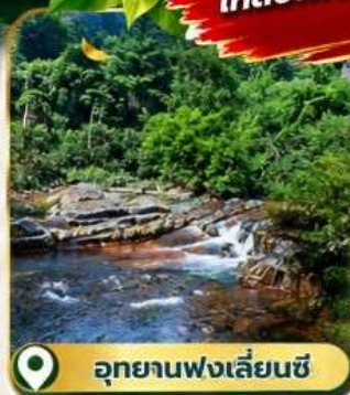
อุทยานฟ่งเลี่ยนซี