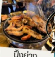
ปิ้งย่าง