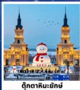
ตึกตาสหิมะยักษ์