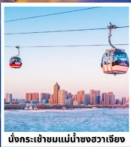
นั่งกระเช้าชมแม่น้ำขงอวาเจียง