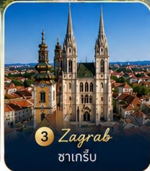
3 Zagreb ซาเกร็บ