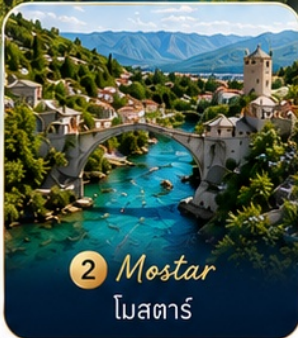
2 Mostar โมสตาร์