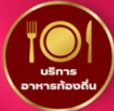
บริการอาหารท้องถิ่น