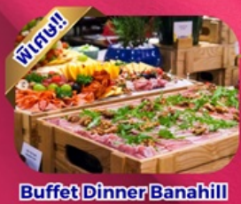
Buffet Dinner Banahill