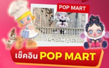
เช็คอิน POP MART