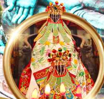
ยืมเงินเจ้าแม่กวนอิมสองฮา