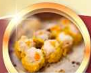
ต้มซ่าต้นตำรับ

гаринดี!! พักทรู 4 ดาว PRUDENTIAL HOTEL ติดถนนนาธาน ย่านช้อปปิ้งจิมซาจуй