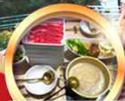
บุฟเฟ่ต์ซาบู เมียร์โมอัน!!