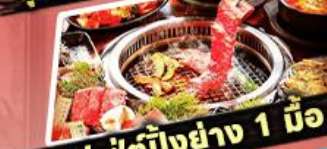
บุฟเฟต์ปิ้งย่าง 1 มื้อ