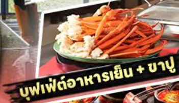
บุฟเฟต์อาหารเย็น + ชาบู