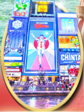
ซ็อบบิง ซินโซบาสึ