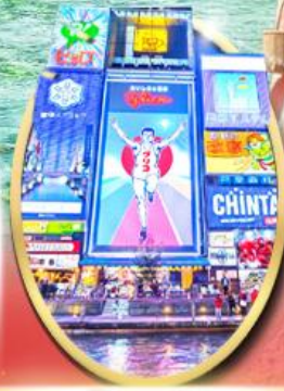
ช้อปปิ้ง ซินโซบาชิ