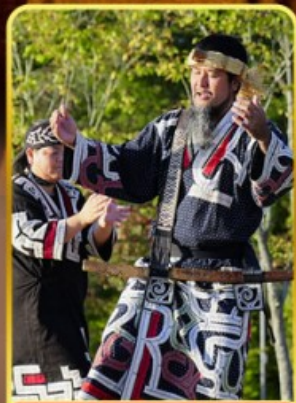
พิพิธภัณฑ์โอนู