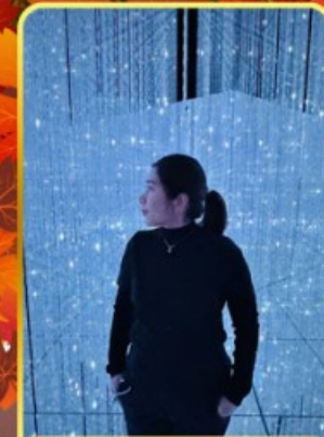
ที่มอลล์โตเกียว