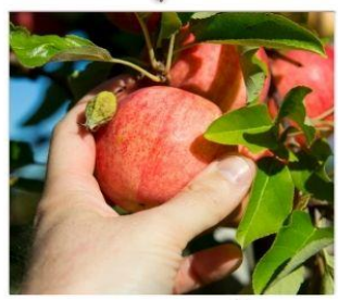
เก็นแอมเบ็ค