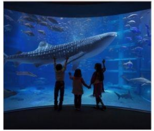
พิพิธภัณฑ์สัตว์น้ำไคยุคัง