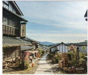
มาโกเมะจุกุ