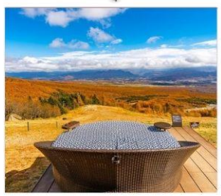
ดิโยซาโตะเทอเรส