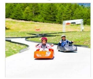
กิจกรรมขับโกคาร์ท