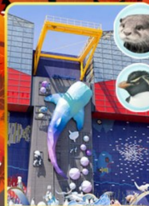
พิพิธภัณฑ์โคยูกิจ