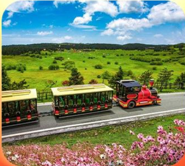
“อุทยานเขานางฟ้า”

บินตรงลงชิง • อุ่หลง หลุมฟ้าสะพานสวรรค์ • ระเบิดยงแกว • อุทยานเขานางฟ้า หงหยาดัง • นิ่งรถไฟทะลุตึก • ล่องเรือชมฉางชิ่งยามค่ำคืน • ศาลาประชาม (ด้านนอก) มรดกโลกผาหินแกะสลักต้าจู้ • เมืองโบราณสี่ปาตี้ • วัดหลิวฮั่น • ตึกตะเกียบ