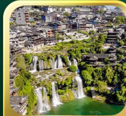
"เมืองโบราณฟูหรงเจิ้น"