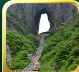
"กำแพงประตูสวรรค์"