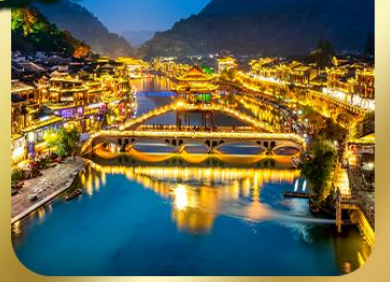
"เมืองโบราณเฟิ่งหวง"