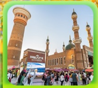
"ตลาดต้าปาจา"

ซินเจียงเหนือ ทะเลสาบโซลิมู๋ "น้ำตาหยดสุดท้ายของแอตแลนติก" • กุ้งหน้านาราตี กุ้งดอกไม้เทียนซาน • ผ่านชมสะพานกั๋วจื่อโกว • ถนนหลิวซิงเจียง • ตลาดต้าปาจา