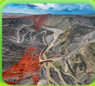
"แกรนด์แคนยอนคู่ชาวจื่อ"

ซินเจียงเหนือ ทะเลสาบโซลิมู๋ "น้ำตาหยดสุดท้ายของแอตแลนติก" • กุ้งหน้านาราตี กุ้งดอกไม้เทียนซาน • ผ่านชมสะพานกั๋วจื่อโกว • ถนนหลิวซิงเจียง • ตลาดต้าปาจา