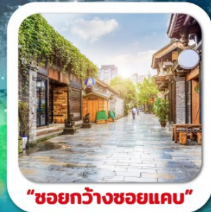
"ซอยกว้างซอแคว"