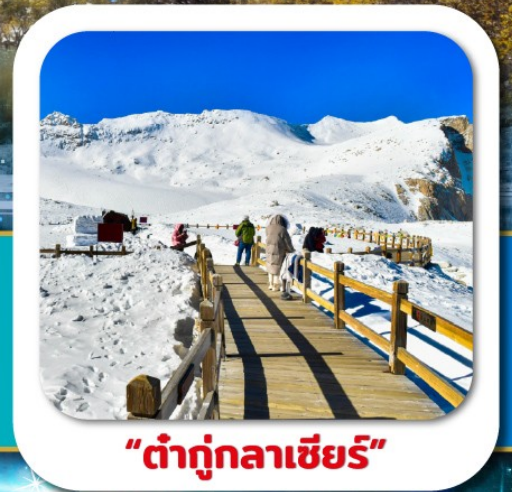
"ต่ากู่กลาเซียร์"

เที่ยวชมความงาม 3 อุทยานชื่อดัง : สี่ดรุณี • ปี่เฟิงโกว ต่ากู่กลาเซียร์ ชมความน่ารักของหมีแพนด้า • จัตุรัสหยางเทียนวู่ ซอยกว้างซอแคว • ถนนคนเดินซุนซีลู่ • POP MART