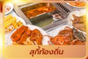
สุกี้ท้องถิ่น