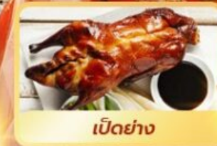
เป็ดย่าง