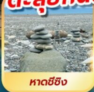
หาดซีซิง

เดินชมวิวเกาะเหอผิง ตะลุยกินตลาดมืชลินเหลาเหอ