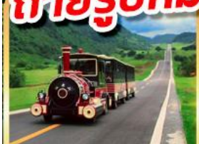
อุทยานนางฟ้า