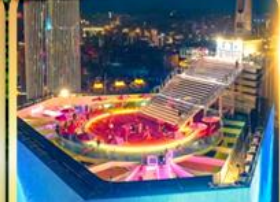
จุดชมวิวจฉงชิ่งเวิลด์ไทม์ 131