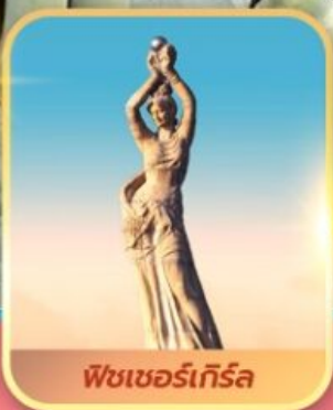
พีชเซอร์เก็รล