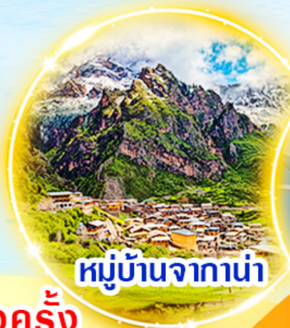
หมู่บ้านจากาน่า