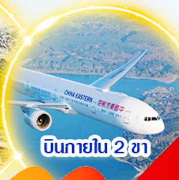
บินภายใน 2 ชม