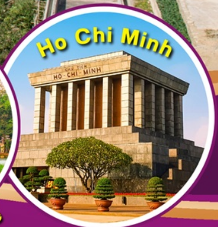
Ho Chi Minh