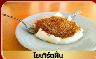
โยเกิร์ตผืน