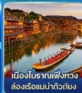
เมืองโบราณเฟิ่งหวง ล่องเรือแม่น้ำถั่วเจียง