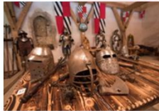
ปราสาทเพรจามา

** พักที่ Radisson Blu Plaza Hotel 4* หรือเทียบเท่า **