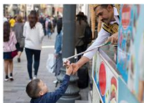
ไอศกรีม Maraş ชมพระอาทิตย์ตกดิน ณ ภูเขาเนมรุต