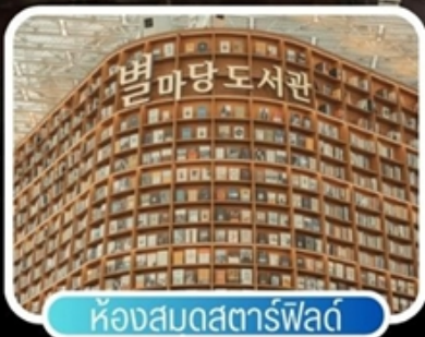
ห้องสมุดสตาร์พาร์ค