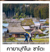
คยาบุกิโนะ: ซาโตะ