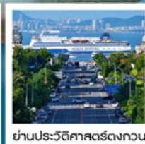
ย่านประวัติศาสตร์ตงกวน

Fisherman's Wharf • จัดริสซิงไห่ (รวมรถราง) • ถนนตงกวน • เวนิสแห่งต้าเหลียน • ถนนรัสเซีย