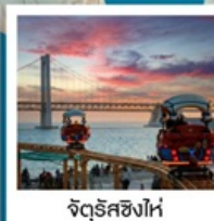
จัดริสซิงไห่